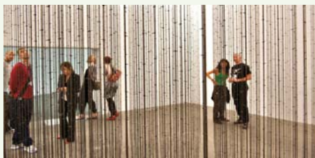
HATOUM Mona. «Impénétrable». 2009.

L'art accompagne la sécularisation du monde. Dans ce mouvement, la relation qui subordonne le sensible à l'esprit semble s'inverser ; jusqu'à ce que, peut-être, l'art se satisfasse des sens.