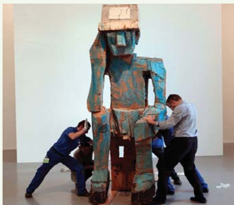
BASELITZ Georges. «Dunklung Nachtung Amung Ding». 2009.

Au moment où la photographie prend en charge la représentation du monde, l'art libère sa part sensible. En s'ouvrant aux sensations, il devient expression.