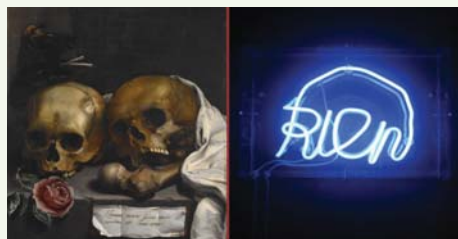
FALK, J. «Vanité». 1629.

Quand, dans l'art classique, les peintres interrogent le monde sensible, c'est pour le subordonner au monde spirituel. Alors, sous couvert d'espace, le temps devient la question première de la peinture.